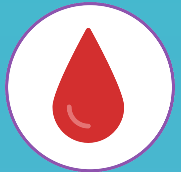
ПРИМЕСИ В КАЛЕ (КРОВЬ, СЛИЗЬ)