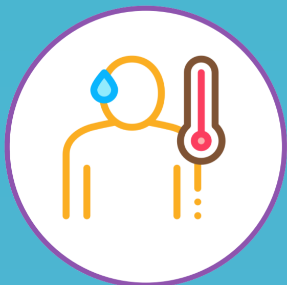
ПОВЫШЕННАЯ ТЕМПЕРАТУРА ТЕЛА