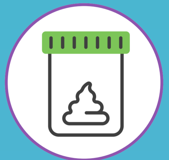
ИЗМЕНЕНИЕ ЦВЕТА И ФОРМЫ КАЛА