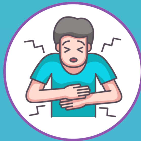
БОЛЬ В ЖИВОТЕ